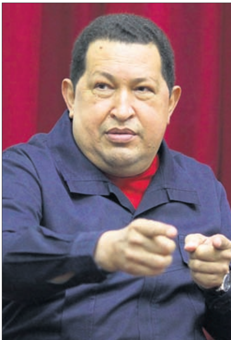
Presidente Hugo Chavez riba un foto aki saca e siman aki.